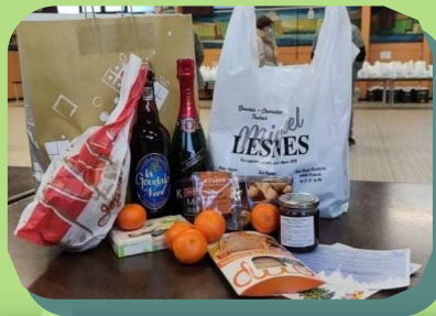
Colis des Aînés et distribution de cougnolles et de friandises aux enfants