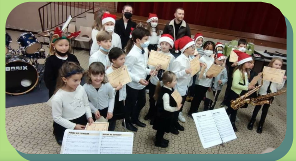
Audition et remise de diplômes à l'école de musique municipale