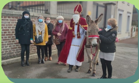
Saint Nicolas aux écoles avec l'APE