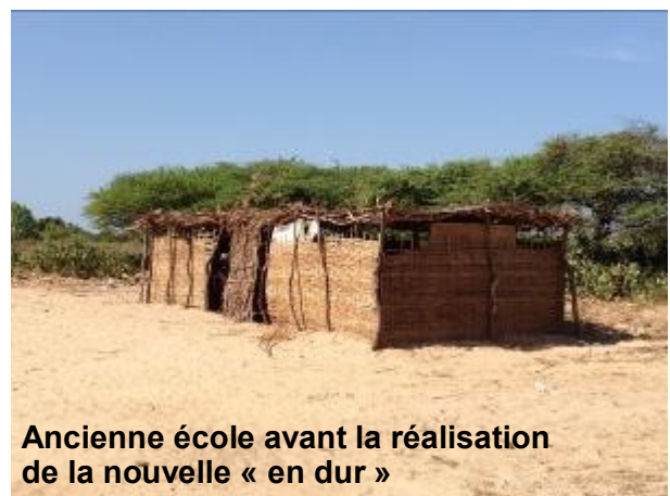
Ancienne école avant la réalisation de la nouvelle « en dur »

En 2021, le projet consistera à s'atteler à une deuxième école en zone rurale, l'école Diol à Gandiole. Il s'agira de la réalisation d'une clôture autour de celle-ci, de la réfection des tableaux des salles de classes et de l'installation de panneaux photovoltaïques. Mais il s'agira aussi de délivrer aux enfants une sensibilisation à la gestion de l'eau, à l'hygiène, au tri des déchets, à l'élaboration d'un potager scolaire. Des fournitures et du matériel scolaire seront donnés à chaque enfant (stylos, cahiers, sac à dos, ...).