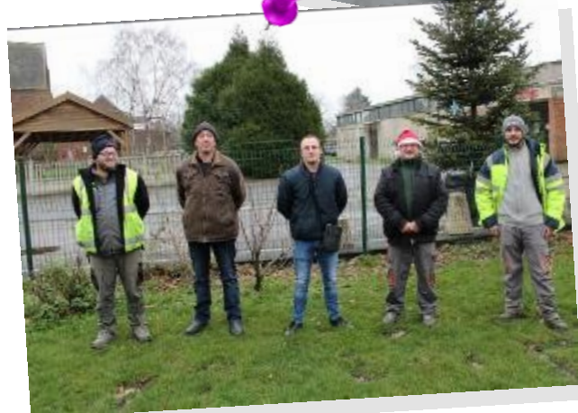
Les masques ont été enlevés le temps de la photo.