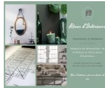
Rêves d'Intérieurs Meubles et décoration d'intérieur

43 Rue Henri Barbusse Tel : 07 82 88 72 34