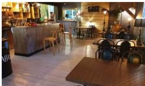
Le « Bistro du Coin » Bar - Brasserie 1 rue Jean Jaurès Tel : 03 27 36 52 76

Le dynamisme d'un village se mesure notamment à son activité commerciale. De nouveaux venus ont repris ou créé des activités ces derniers mois. Fortement impactés pour certains par la crise COVID-19, ils tiennent le cap pour notre Commune et gageons que cette année verra leur plein épanouissement.