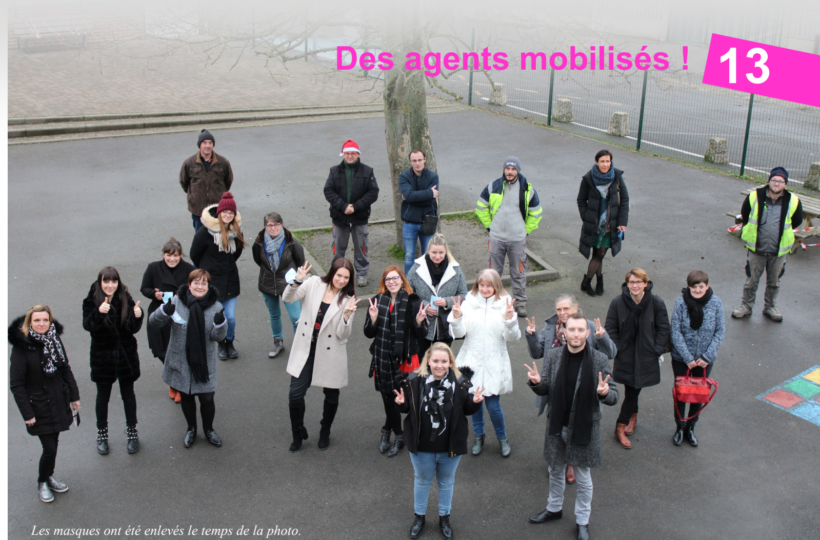
Les masques ont été enlevés le temps de la photo.

Dès l'annonce de l'état d'urgence, des aménagements dans les bâtiments communaux, dans les procédures de travail et dans les interactions au sein des services municipaux ont été mis en place : via des réunions de concertation et un Plan de Continuité d'Activité (PCA), tout a été réorganisé selon deux objectifs, assurer les missions indispensables à la population et protéger les agents. Depuis maintenant 10 mois, les personnels de la Commune dépensent une énergie incroyable dans la gestion de la crise au quotidien et font preuve d'une capacité d'adaptation sans cesse renouvelée en fonction des directives gouvernementales successives et des fluctuations des indicateurs sanitaires.