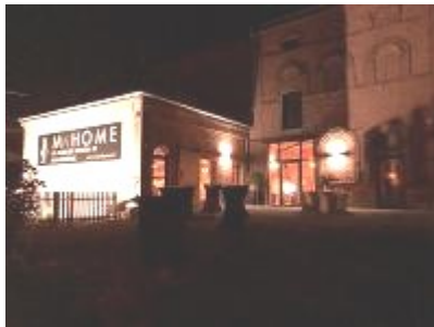
M&Ms HOME Mobilier et décoration design 2 rue de Jenlain Tel : 03 27 42 37 16