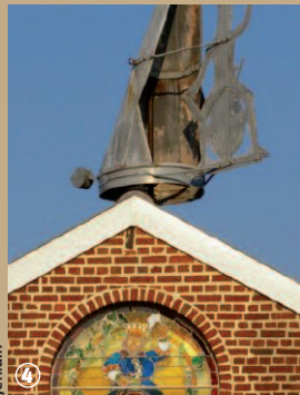
Eglise de Préseau